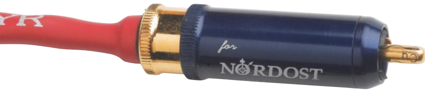
Die hervorragenden WBT Nextgen-Stecker sind inzwischen Standard bei den Nordost-Kabeln mit Cinch-Anschluss