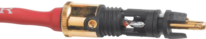
Die Leiter werden per Hand mit Silberlot an die Stecker gelötet. Im Bild schön zu sehen sind die beiden nichtleitenden „Klammern“ des äußeren Kontakttrings, die zusammen mit der einzig leitenden Kontaktfläche (hinten) auf die Buchse am Phonopreamp gepresst werden