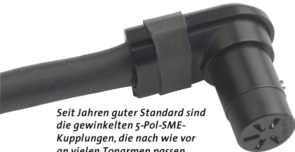
Seit Jahren guter Standard sind die gewinkelten 5-Pol-SME-Kupplungen, die nach wie vor an vielen Tonarmen passen

Wir widmen uns in diesem Test den drei aktuellen Phonokabeln aus Massachusetts, die auf die schönen nordischen Namen Frey, Heimdall und Tyr hören – man kann den kreativen Köpfen bei Nordost ein gewissen Faible für die nordische Sagenwelt nicht absprechen.